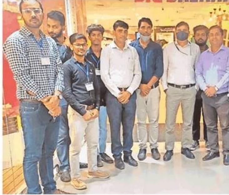
हकेंवि के छात्र अपने शिक्षकों के साथ